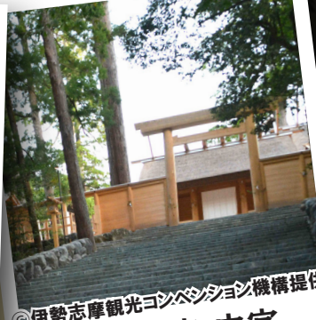
伊勢神宮 内宮