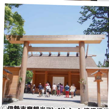
伊勢神宮 外宮